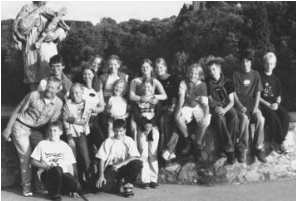
Die Kinderruderer in Limburg